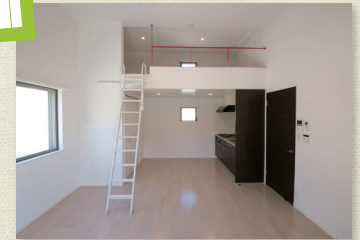
ロフトのある居室(Aタイプ)