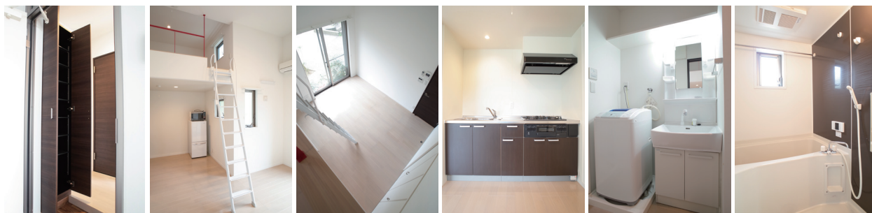
※反転タイプあります。※実際と異なる場合は現況を優先いたします。