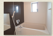
追炊機能付ユニットバス