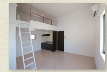
ロフトのある居室(Aタイプ)