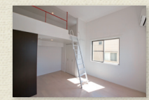
ロフトのある居室(Cタイプ)