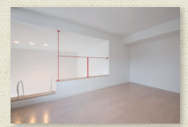
隠れ家的なロフトスペース