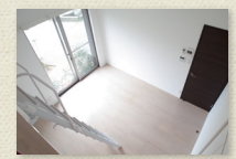
ロフトから眺める居室