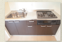
3口ガスコンログリル付キッチン