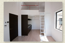
ロフトのある居室(Cタイプ)