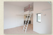
ロフトのある居室(Bタイプ)