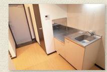
廊下/キッチンスペース