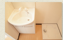
シャンプードレッサー