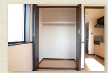
豊富な収納スペース