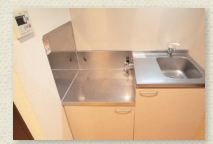
ガスコンロ持込キッチン