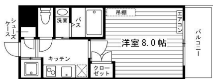
Aタイプ 1K (23.4㎡)