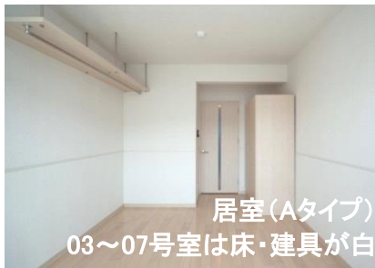
居室(Aタイプ) 03~07号室は床・建具が白