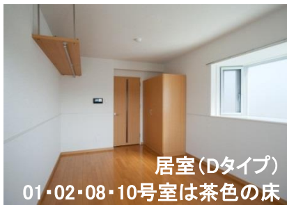
居室(Dタイプ) 01・02・08・10号室は茶色の床