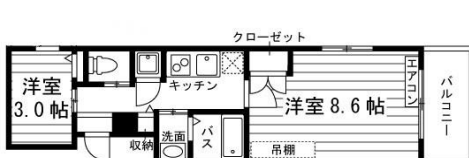
Eタイプ 2K (31.9㎡)