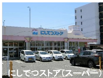
にしつストア(スーパー)