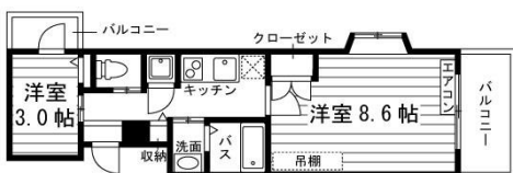
Dタイプ 2K (31.9㎡)