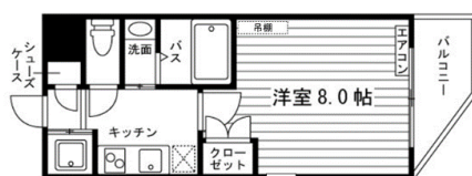
Bタイプ 1K (23.4㎡)