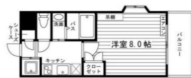
Fタイプ 1K (23.4㎡)