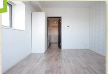
アクセントウォールがお洒落な居室1