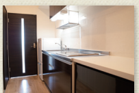
ダークブラウン調のキッチン