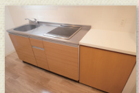
2口IHコンロ付キッチン