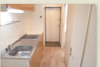
木目調のキッチン