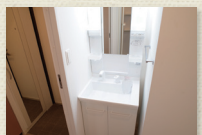
シャンプードレッサー